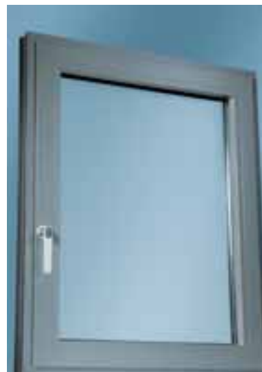
Klare Linienführung durch verdeckt liegende Beschläge Unbroken lines thanks to concealed fittings

Schüco TipTronic can be used with the following Schüco series: Royal S 70.HI, Royal S 75BS.HI, Royal S 105V, Royal S 75.HI + .