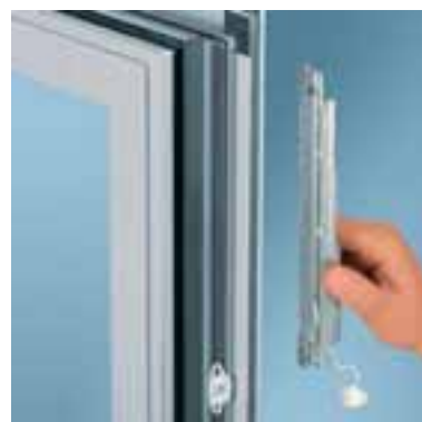
Einfache Montage spart Zeit und Kosten Easy, cost-efficient and time-saving assembly