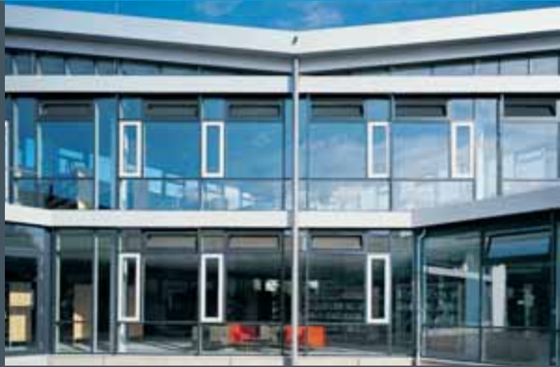
Stadt- und Schulbibliothek Kelsterbach, Deutschland Kelsterbach City and School Library, Germany