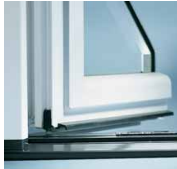
Die barrierefreie Türschwelle bietet Komfort, Sicherheit und Perfektion im Detail

Schüco Profile und Zubehörteile werden nach DIN EN ISO 9001 hergestellt und unterliegen einer strengen Qualitätsprüfung. Die Weiterverarbeitung von Schüco Profilen und Zubehörteilen durch Schüco Fachbetriebe findet gemäß den Richtlinien und Qualitätsstandards von Schüco statt.